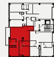
UBICACIÓN EN PLANTA

SC SALÓN COMEDOR B1 BAÑO 1 C COCINA B2 BAÑO2 D1 DORMITORIO 1 A ACCESO D2 DORMITORIO 2 T TERRAZA D DISTRIBUIDOR